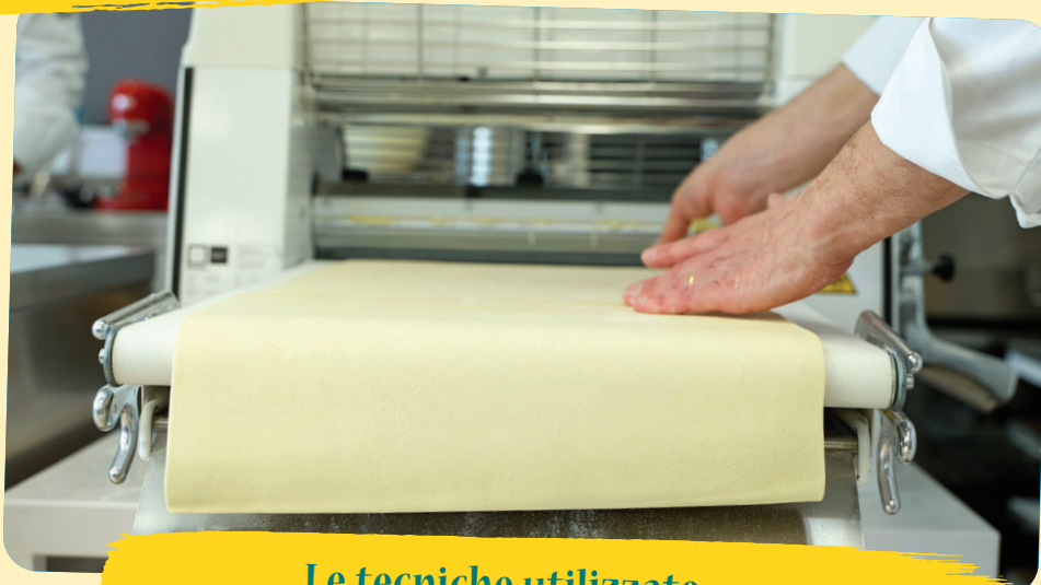
Le tecniche utilizzate

Tre le tecniche utilizzate: pasta sfoglia classica, rapida e invertita , per un prodotto che, secondo il Maestro "sarà il prossimo grande protagonista della prima colazione". Le innovazioni principali hanno visto l'uso di farine biologiche; liquidi alternativi , come vino bianco, aceto o acido ascorbico, permettendo così di abbattere drasticamente i tempi di riposo; e un' estetica naturale , tramite colorazione dell'impasto con ingredienti come barbabietola o cacao. Una natura estremamente versatile, quella della sfoglia, interpretata sia in chiave dolce che salata, per preparazioni cariche di gusto e carattere.