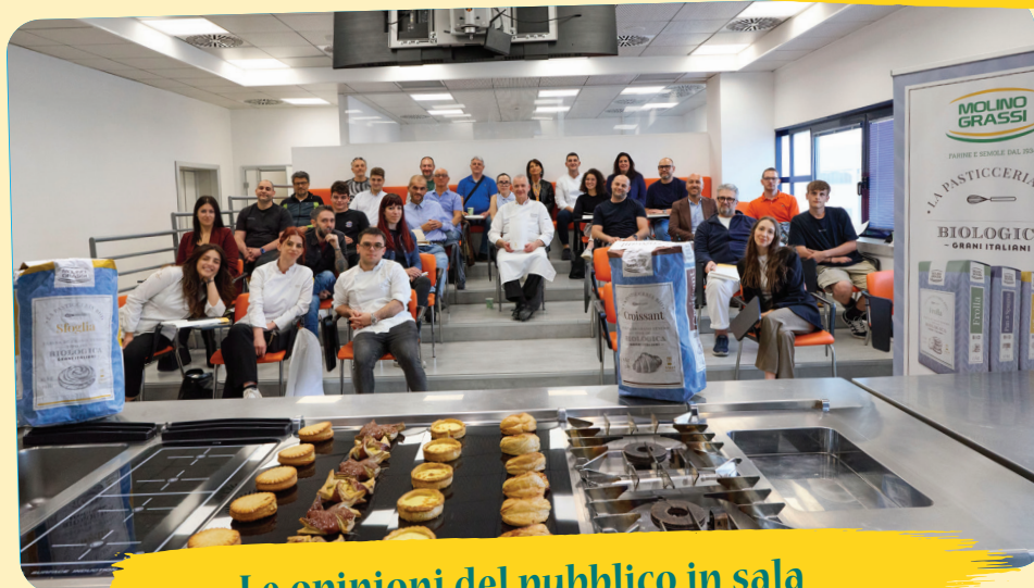
Le opinioni del pubblico in sala