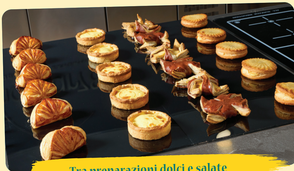
Tra preparazioni dolci e salate